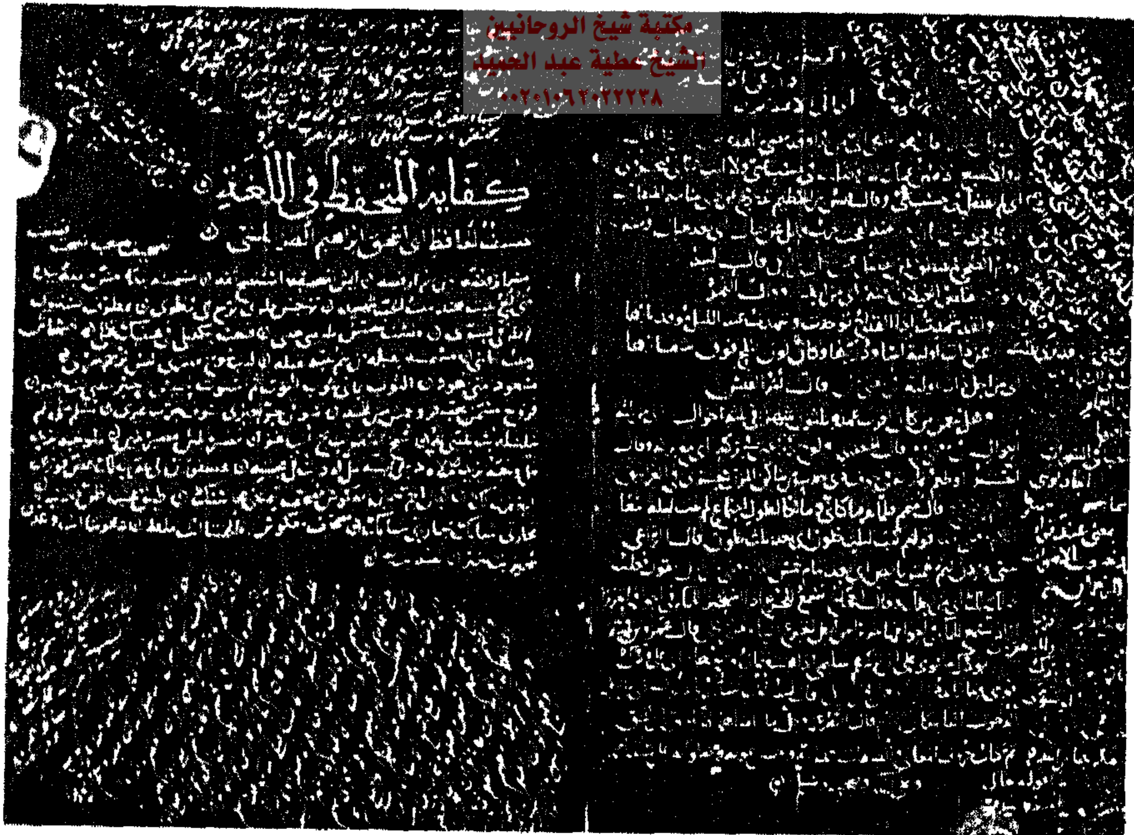
٣ - صورة الورقة الأخيرة من كتاب «حروف المعاني».